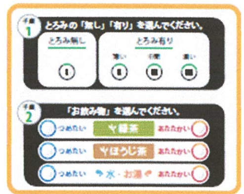
操作パネル拡大図